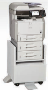
Bandeja Estándar con dos Bandejas de 500 hojas