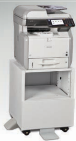
Bandeja Estándar de 500 hojas