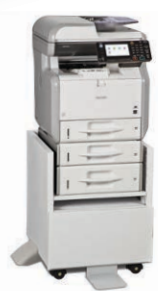
Bandeja Estándar con una Bandeja de 250 hojas y una de 500 hojas