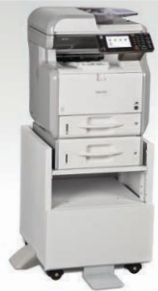
Bandeja Estándar con Bandeja de 500 hojas