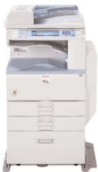
MP 2550B/MP 3350B