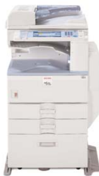
MP 2550SP/MP 3350SP

Para un copiado sólido y una ruta de actualización flexible a las funciones de impresión, fax y escaneo en blanco y negro.